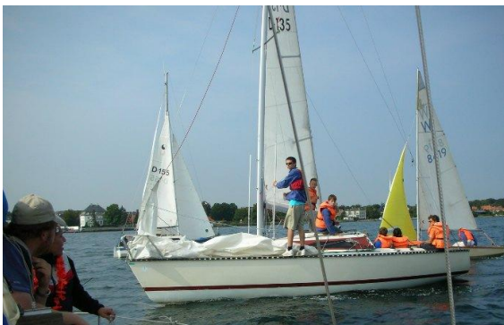
Laxen under Distriks kapsejlad

På parkeringspladsen når vi at læse det sidste kapitel af Mio min Mio. Rigtig god bog.